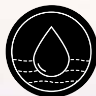
CHAKRA 4 Vand ( jal )