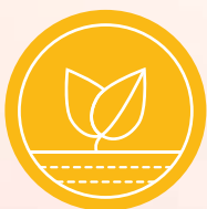
CHAKRA 1 Jord ( prithvi )