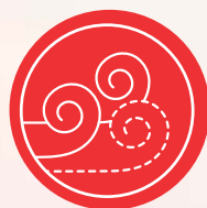
CHAKRA 2 Rum ( akasha )