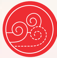
చక్రం 2 ఆకాశం