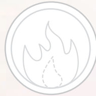
చక్రం 3 అగ్ని