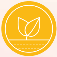
చక్రం 1 పృథ్వీ