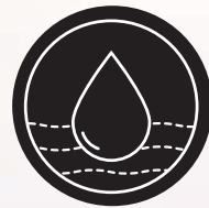
చక్రం 4 జలం