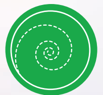
చక్రం 5 వాయు